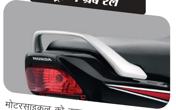
स्ट्रॉन्ग ग्रैब रेल